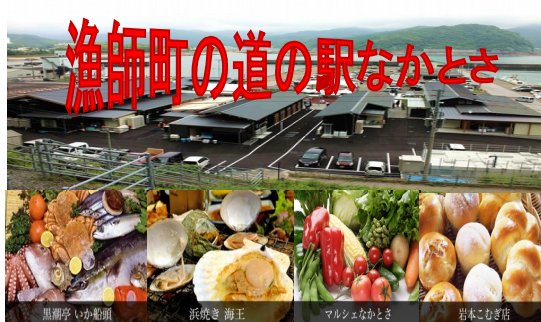
漁師町の道の駅なかとさ